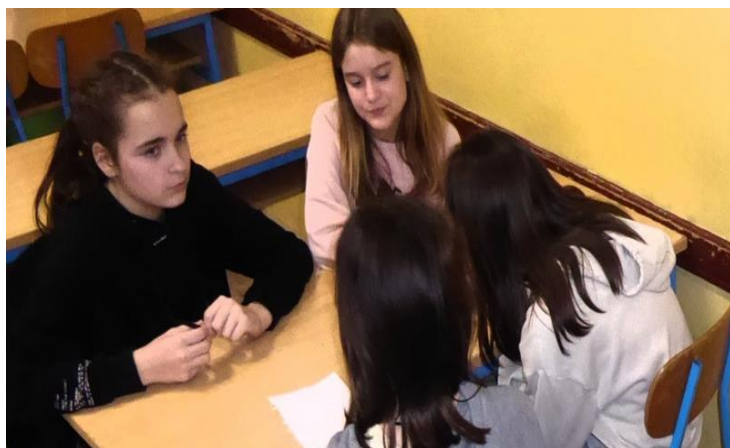
Intervju s učenicama 7.a razreda